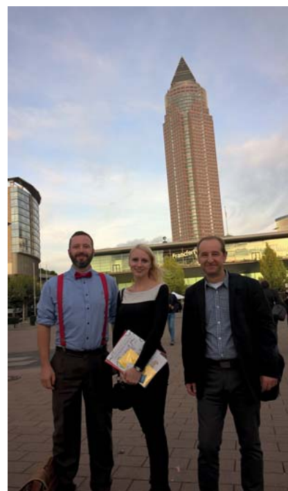
Tým Bible21 ve Frankfurtu